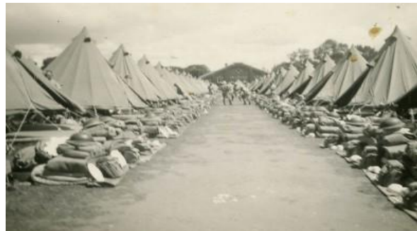
Tentenkamp in Orilla

Op 7 december 1943 wordt hij overgeplaatst naar het #26 Canadian Army Basic training Centre te Orilla, Ontario.